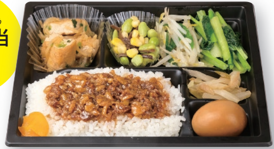
魯肉飯 + 副菜4品 + 煮玉子 + 漬物