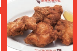
台湾唐揚(たいわんからあげ)