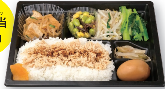
鶏肉飯 + 副菜4品 + 煮玉子 + 漬物