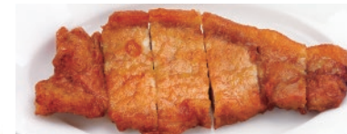
唐山排骨(ばーこー)