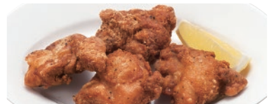
台湾唐揚(たいわんからあげ)