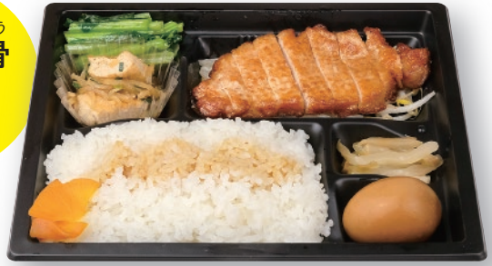
台湾カツレツ + 副菜3品 + 煮玉子 + 漬物